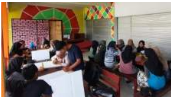
Gambar 2.16 Proses Produksi video 1000 Candi