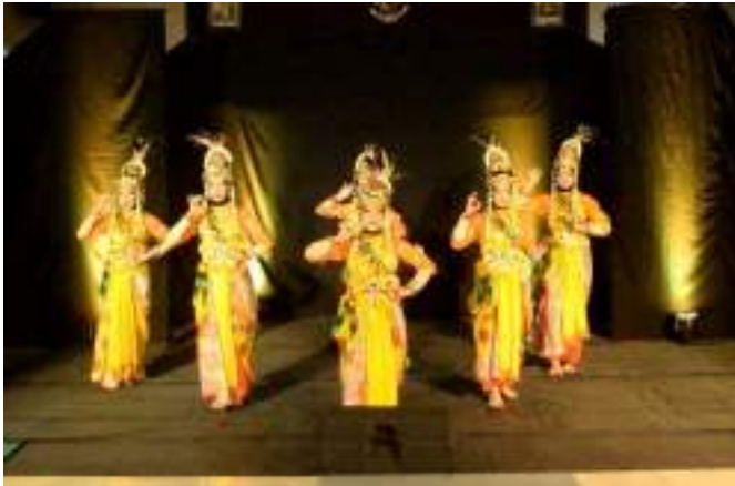
Gambar 3.38 Salah satu aksi perform Tari Gambar Inten

mengisahkan kesetiaan seorang wanita menanti kekasihnya yg berada di medan perang demi masyarakat pesisir prigi agar lebih sejahtera. Peringatan pernikahan mereka hingga kini dilaksanakan oleh masyarakat dgn larung Sembonyo. Tari untuk kelas rendah (Kelas 1 - 3 SD)