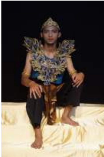
Gambar 2.20 Pemeran Guruminda