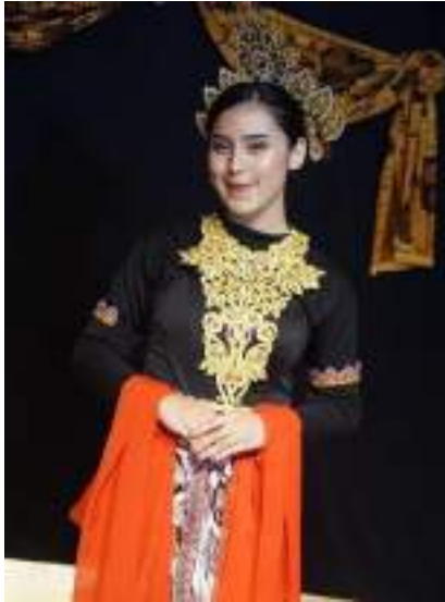
Gambar 2.24 Pemeran Sunan Ambu