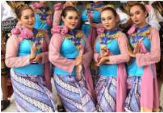
Gambar 3.19 Rancangan kostum Tari Nelayan Prigi