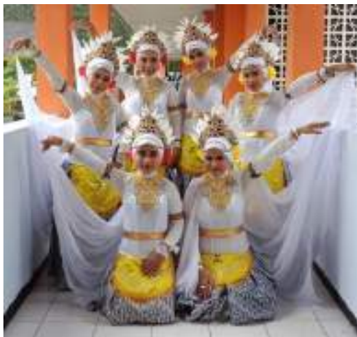
Gambar 3.16 Rancangan Kostum tari “Burung Kuntul”