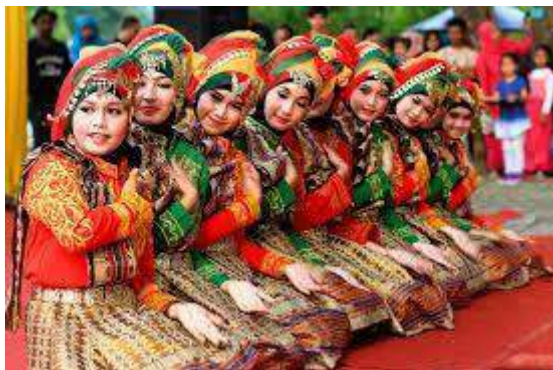
Gambar 3.3 Tari Saman

Tari Pada Masa Budaya Islam tidak terlibat dalam tata cara serimonial keagamaan. Tariannya lebih mengarah pada kegiatan sosial.