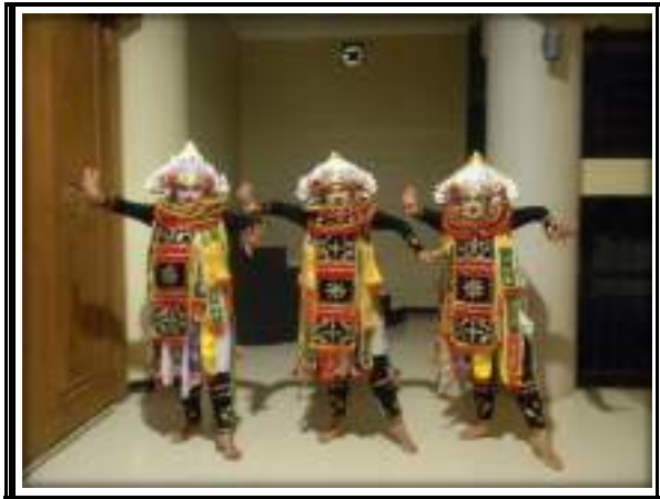
Gambar 3.7 Tari Baris