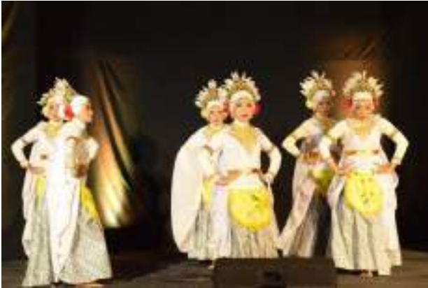
Gambar 3.14 Salah satu aksi perform Tari Burung Kuntul

dibutuhkan sumber ide yang berasal dari mana saja termasuk dari kearifan lokal daerah sekitar.