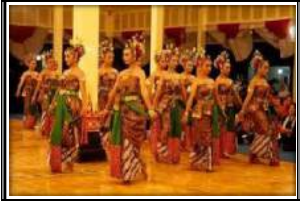
Gambar 3.9 Tari Bedhaya