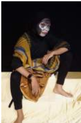
Gambar 2.22 Pemeran Lutung Kasarung