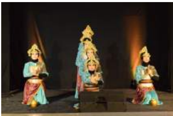
Gambar 3.32 Salah satu aksi perform Tari Tirta Kuncoro

Manggala Yudha mendapatkan wangsit untuk membuat sumber air. Beliau berdoa kepada Sang Hyang Widhi untuk diberikan petunjuk dimana titik mata air yang dimaksud. Secara tiba tiba keluarlah sumber mata air dari tanah yang dipijak. Adanya sumber yang digedong, maka masyarakat sekitar Mbelik mengenal daerah tersebut Kelurahan Sumbergedong. Tari untuk kelas tinggi (Kelas 4 - 6 SD)