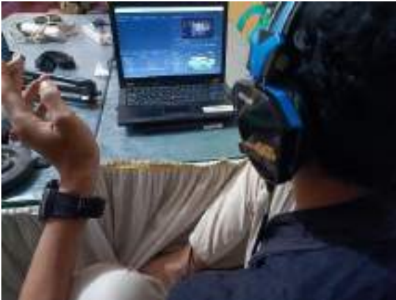
Gambar 2.38 Proses Editing Video

Editing video drama ini dilakukan oleh editor, yaitu melakukan editing program dengan mengumpulkan, memilih, memotong, menyambung gambar- gambar hasil shoting dan mengurutkan, menata