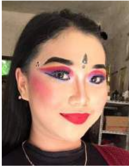
Gambar 1.15 Tata rias tari tradisi Bali