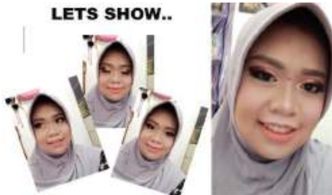
Gambar 1.14 hasil akhir tata rias cantik