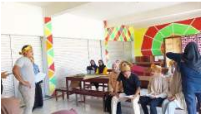
Gambar 2.18 Proses Produksi video 1000 Candi