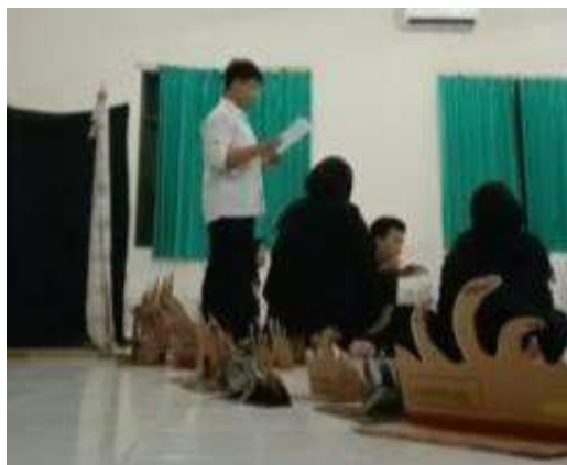
Gambar 2.53 Latihan Kelompok Bawang Merah Bawang Putih