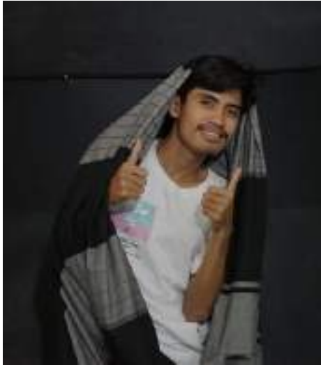
Gambar 2.50 Pemeran Batu