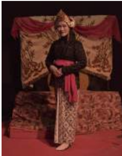
Gambar 2.4 Pemeran Roro Jonggrang