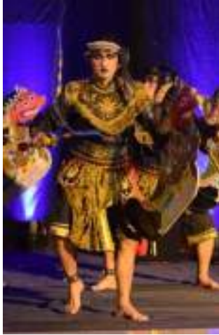
Gambar 3.28 Konsep Tata Rias dan Kostum Tari Turonggo Yakso.

Awal kisah ada raksasa yang sedang berkeliaran di suatu tempat, yang kemudian diketahui oleh dadung awuk kemudian memerintahkan kesatria untuk menangkap buto tersebut yang kemudian setelah berhasil dijinakkan dan kemudian dijadikan satu dengan kuda tunggangan para kesatria.