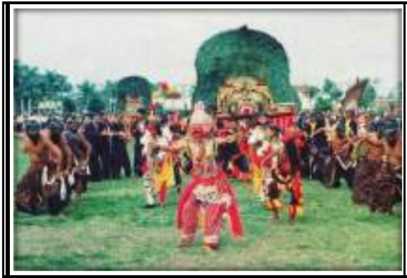
Gambar 3.10 Tari Reog Ponorogo