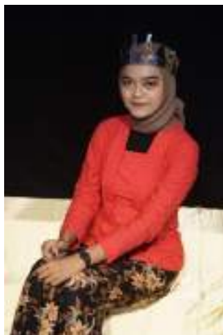
Gambar 2.29 Pemeran Purbaendah