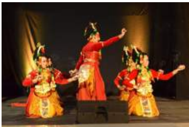
Gambar 3.40 Salah satu aksi perform Tari Ngerit Ayu

berkelana untuk menaklukkan jin saat bertapa ia dikelilingi bunga yg harum mewangi sehingga dinamakan putri ngerit. Tari untuk kelas rendah (Kelas 1 - 3 SD