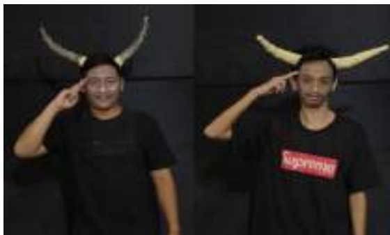
Gambar 2.48 Pemeran Kerbau