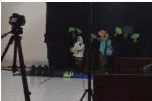
Gambar 2.55 Take Video Bawang Merah Bawang Putih