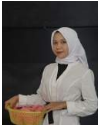
Gambar 2.41 Pemeran Bawang Putih