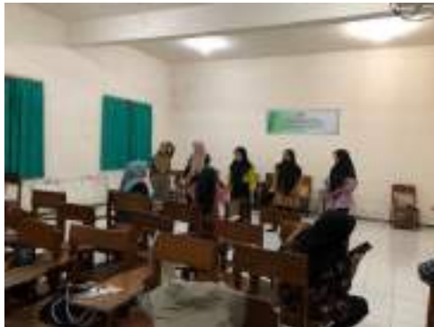
Gambar 2.35 Proses Latihan