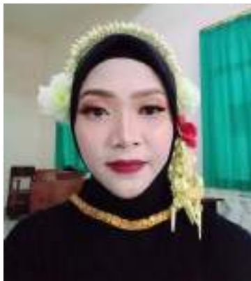
Gambar 3.21 Rancangan tata rias Tari Nelayan Prigi

nyadran dan larung kepala kerbau di DAM Bagong. Representasi tata rias ini menggambarkan kearifan lokal “Nyadran DAM Bagong” melalui semangat masyarakat Ngantru. Hiasan kepala terdiri dari kalungan dan hiasan bunga melati yang melambangkan kesucian.