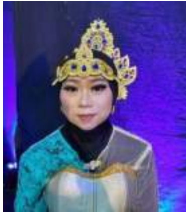
Gambar 3.33 Konsep tata Rias Tari Tirto Kuncoro

Tata rias menurut Sedyawati (1982:86) adalah seni menggunakan bahan-bahan kosmetik untuk mewujudkan wajah peran. Kegunaan rias dalam pertunjukan adalah merias tubuh manusia dengan mengubah yang alamiah menjadi lebih artistic dengan prinsip mendapatkan daya guna yang tepat. Sumaryono (2006:100) membagi dua bentuk tata rias, yaitu tata rias realis dengan tata rias simbolik. Tata rias realis berfungsi untuk