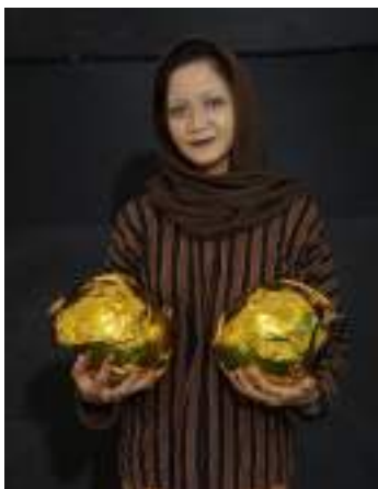
Gambar 2.44 Pemeran Nenek Labu