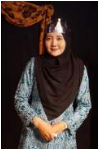
Gambar 2.27 Pemeran Purbamanik