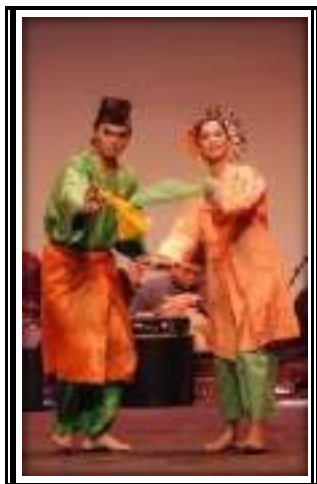
Gambar 3.5 Tari Zapin Melayu

Pertunjukan tari yang disajikan oleh dua orang penari secara interaktif di atas panggung.