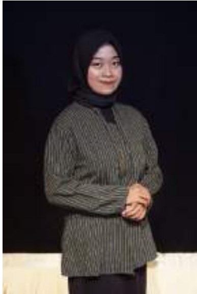
Gambar 2.32 Pemeran Dayang Kerajaan