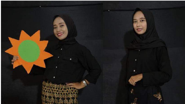
Gambar 2.52 Pemeran Bunga dan Mbak-mbak