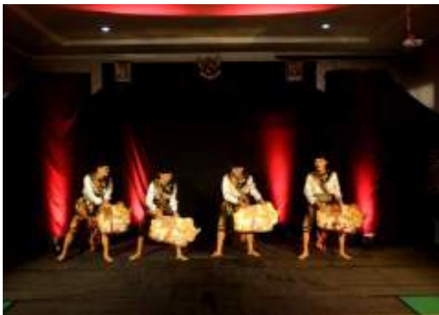
Gambar 3.25 Salah satu aksi perform Tari Gajah Seto

membawa kemakmuran bagi masyarakat. Konon, Ki Ageng Menak Sopal membangun Dam Bagong di Kelurahan Ngantru Trenggalek, tepatnya di sisi barat tempat pusara Ki Ageng Menak Sopal.