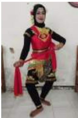
Gambar 3.22 Rancangan kostum Tari Sirih Mahesa

Merah melambangkan keberanian dan semangat yang membara dalam melestarikan budaya. Hitam melambangkan ketegasan. Emas melambangkan kejayaan.