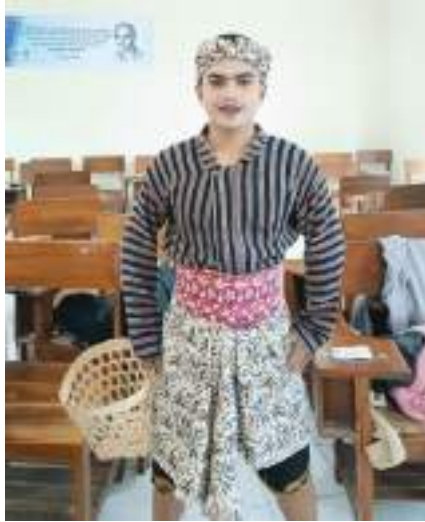
Gambar 3.37 Konsep Kostum Tari Kopi Pamupus Prajana