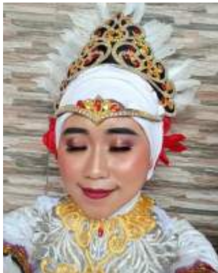
Gambar 3.15 Rancangan tata rias tari “Burung Kuntul” Dokumentasi Pribadi

penyampaian keindahan dan keelokan burung kuntul.