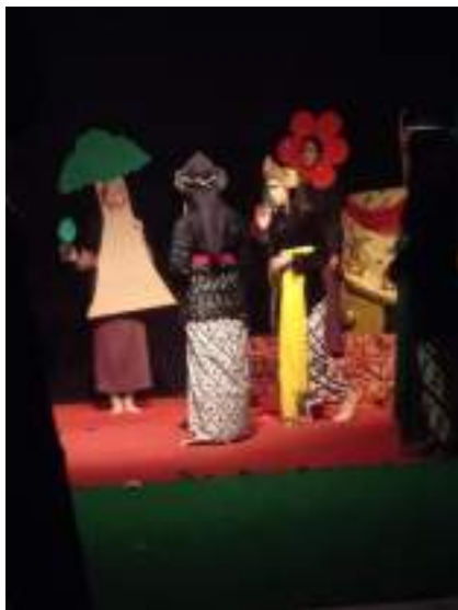
Gambar 2.19 Proses Produksi video 1000 Candi