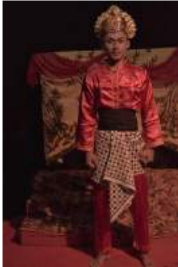
Gambar 2.5 Pemeran Prabu Baka