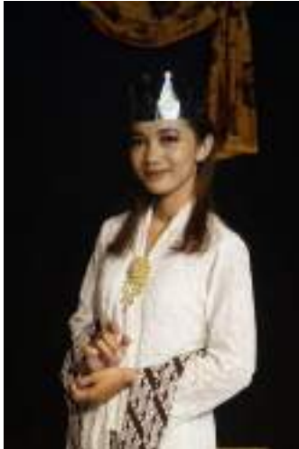
Gambar 2.21 Pemeran Purbasari