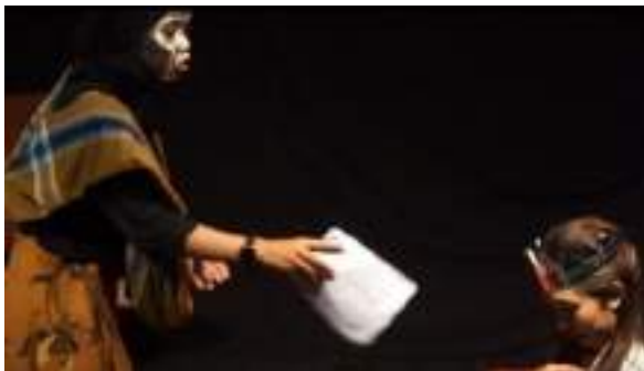
Gambar 2.36 Proses Gladi Bersih

Gladi bersih dilakukan di panggung pada saat sebelum take video. Hal ini