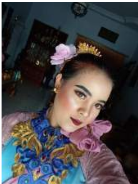
Gambar 3.18 Rancangan tata rias Tari Nelayan Prigi

sedang berangkat mencari ikan dilaut. Dan representasi kecantikan para nelayan prigi dengan kebaya dan sanggul mempesonanya.