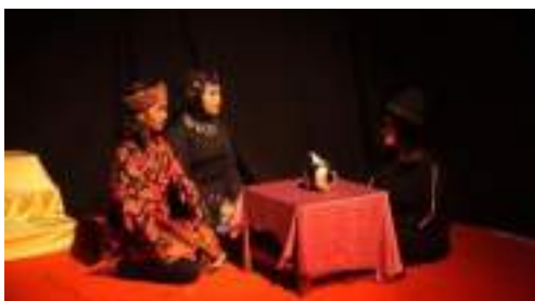
Gambar 2.37 Proses Take Video