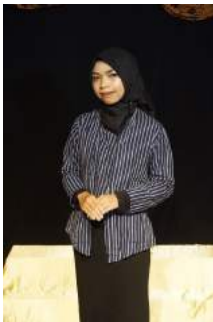
Gambar 2.33 Pemeran Dayang Kerajaan