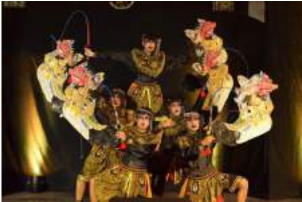
Gambar 3.27 Salah satu aksi perform Tari Turonggo Yakso