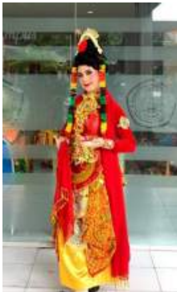
Gambar 3.41 Konsep Tata Rias dan Kostum Tari Ngerit Ayu

terlihat mempesona sehingga karakternya dapat tervisualisasikan.