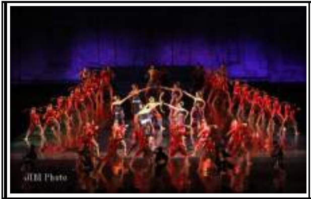
Gambar 3.8 Tari Kolosal