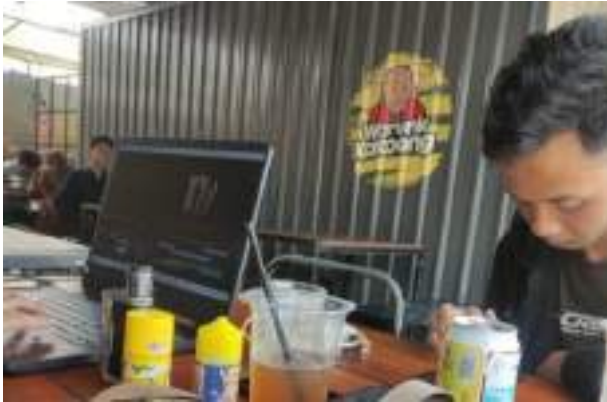
Gambar 2.56 Editing Video Bawang Merah Bawang Putih

Editing video drama ini dilakukan oleh editor. Dalam pembuatan video drama kelas 6B ini editing dilakukan sendiri dengan mengambil beberapa anak yang bisa mengedit, yaitu melakukan editing program dengan mengumpulkan, memilih, memotong, menyambung gambar-gambar hasil shooting dan mengurutkan, menata gambar dan suara, music backsound, sound effect hingga finishing sesuai