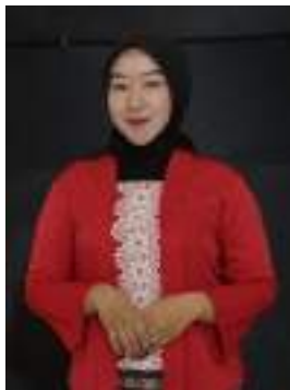
Gambar 2.40 Pemeran Bawang Merah