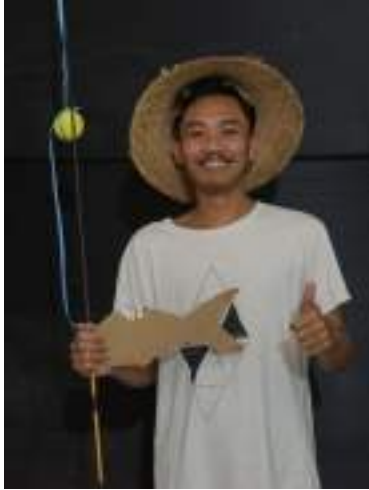
Gambar 2.51 Pemeran Tukang Mancing