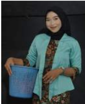
Gambar 2.47 Pemeran Bawang Prei