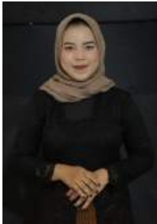
Gambar 2.42 Pemeran Ibu Tiri