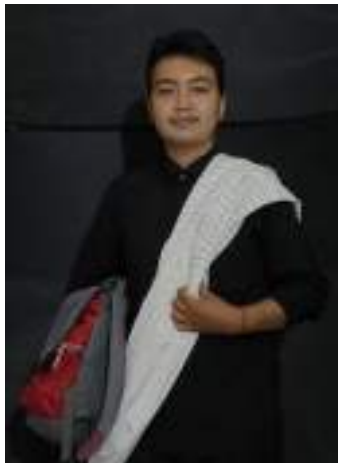
Gambar 2.43 Pemeran Ayah