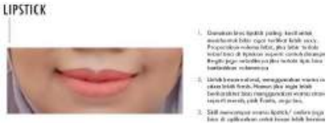
Gambar 1.13 Tahap lipstick