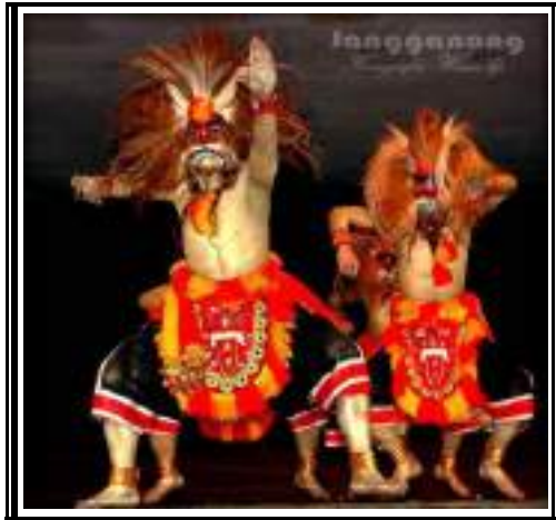
Gambar 3.12 Tari Bujang Ganong