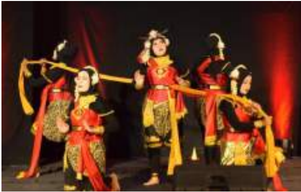
Gambar 3.20 Salah satu aksi perform Tari Sirah Mahesa