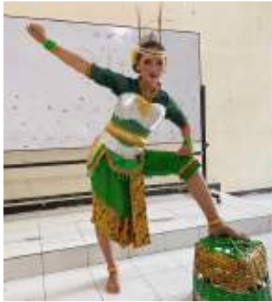
Gambar 3.24 Rancangan Tata Rias dan Kostum Tari Krigan Tani Dokumentasi Pribadi

Busana yang dipakai sesuai dengan tema penari. Menggunakan busana petani yang telah dimodifikasi