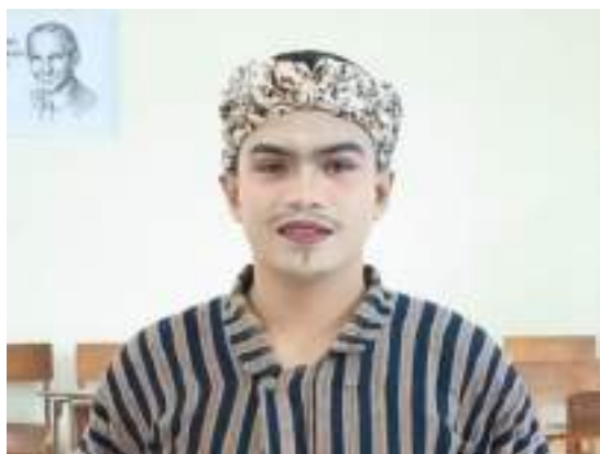
Gambar 3.36 Konsep tata Rias Tari Kopi Pamupus Prajana

petani yang bekerja menanam kopi untuk Belanda namun mereka terintimidasi. Ikat kepala memberikan symbolsemangat berjuang para petani melawan penjajah serta menambah keindahannya.