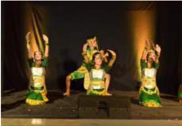
Gambar 3.23 Salah satu aksi perform Tari Krigan Tani