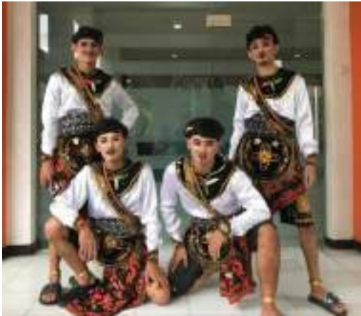
Gambar 3.26 Konsep Tata Rias dan kostum Tari Gajah Seto Dokumentasi Pribadi

Tata rias pada “Gajah Seto ” mengambil struktur rias jaranan dimana menggambarkan penari jaranan sehingga karakternya tervisualisasikan. Representasi tata rias ini menggambarkan penunggang gajah putih mbok krandong.