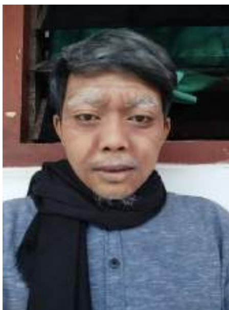
Gambar 1.16 Tata rias karakter tua

digunakan untuk membentuk karakter / watak tertentu, sebagai contoh pemakaian eye shadow gelap guna memberi aksentuasi karakter yang galak atau penggunaan guratan-guratan pencil alis di dahi untuk karakter tua.