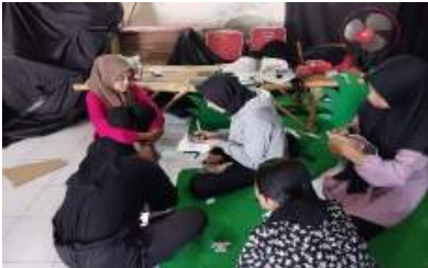
Gambar 2.39 Behind the scene

Behind The Scene artinya adalah di belakang layar. Maksudnya adalah, kejadian apa saja yang tidak diketahui oleh penonton dalam sebuah film, video, maupun