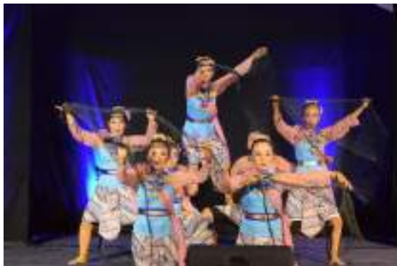
Gambar 3.17 Salah satu aksi perform Tari Nelayan Prigi

Prigi diambil koreografer dari sumber ide tema kearifan lokal. Tari ini di tampilkan pada 6 Juli 2023 di event Gelara Karya Tari Ujian Akhir Semester Prodi PGSD. Analisis kebutuhan penciptaan karya tari mengacu kepada hasil Penelitian Kebudayaan Tradisi para nelayan Prigi di desa tasikmadu Kec . Watulimo Kab . Trenggalek. Para nelayan Prigi memiliki keseharian.