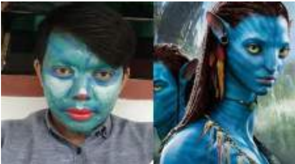
Gambar 1.17 Contoh Tata rias fantasi

Tata rias fantasi adalah karakter khusus, karena menampilkan wujud rekayasa/ buatan yang mengubah wajah menjadi tidak realistis. Tata rias atau make up fantasi menggambarkan tokoh – tokoh non manusia dan seluruh hal yang tidak nyata keberadaannya atau lahir berdasarkan daya khayal seseorang. Contoh karakter fantasi antara lain hewan, tumbuhan, tata rias untuk tokoh kartun, horror, dan lain sebagainya.