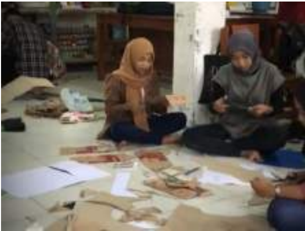
Gambar 2.57 Behind The Scene Bawang Merah Bawang Putih