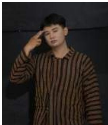
Gambar 2.46 Pemeran Bawang Bombai