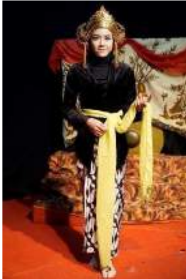
Gambar 2.6 Pemeran Roro Anteng

Anteng adalah tata rias cantik yang menggambarkan puteri yang lemah lembut.