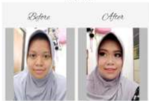
Gambar 1.1 Target final tata rias cantik