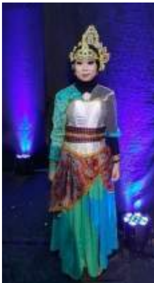
Gambar 3.34 Konsep kostum Tari Tirto Kuncoro

mempertegas atau mempertebal garis-garis wajah, dimana penari tetap menunjukkan wajah aslinya sekaligus mempertajam ekspresi dari karakter tarian yang dibawakan. Sedangkan tata rias simbolik adalah yang memakai garis-garis diwujudkan melalui gerak-gerak yang ritmis dan indah serta terpola.