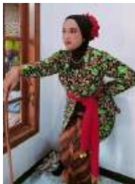
Gambar 3.31 Rancangan tata rias tari “Jagaddhita Krandon”

Kostum tari “Jagaddhita Krandon” menggunakan kombinasi nenek-nenek dengan konsep komedian lucu.