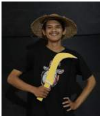
Gambar 2.45 Pemeran Penggembala kerbau