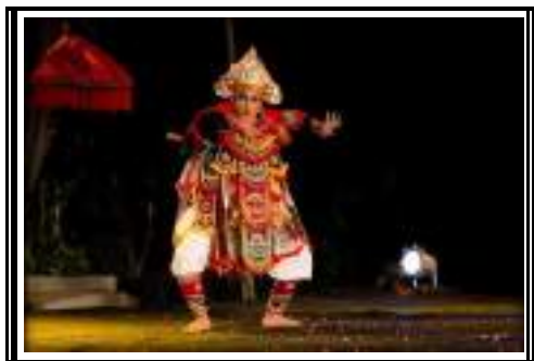
Gambar 3.4 Tari Baris

Sebuah pertunjukan tari yang disajikan oleh satu orang penari di atas panggung.