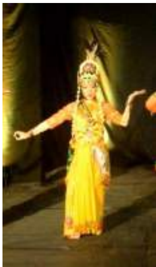
Gambar 3.39 Konsep Tata Rias dan Kostum Tari Putri Gambar Inten Dokumentasi Pribadi

mengambil struktur rias temanten jawa. Berkarakter Putri Alus dari pantai selatan menggunakan warna natural namun terlihat mempesona sehingga karakternya terlihat anggun.