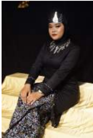
Gambar 2.25 Pemeran Purbararang

a) Karakter Tokoh : Angkuh, sombong, semena-mena, jahat (Antagonis).