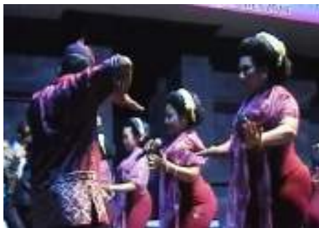
Gambar 3.1 Tari Tayub

Tari Pada Masyarakat Berbudaya Primitive Berhubungan dengan berbagai macam kegiatan religi dan sosial. Difungsikan sebagai tanda peristiwa penting. Misal kelahiran, kematian, kedewasaan dsb. Sehingga berkaitan erat dengan alam lingkungan dan makhluk. Gerak tariannya memiliki unsur 3 macam magi yang disampaikan.