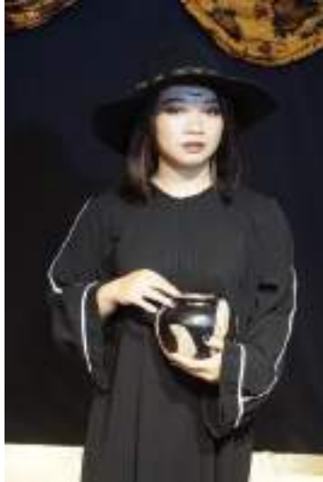
Gambar 2.34 Pemeran Tante Sihir