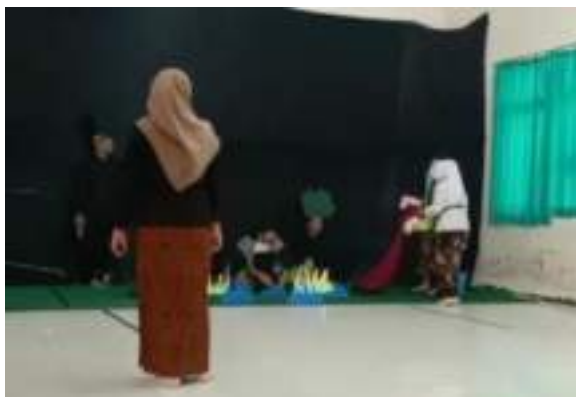
Gambar 2.54 Gladi Bersih Kelompok Bawang Merah Bawang Putih