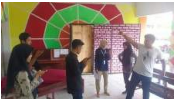
Gambar 2.17 Proses Produksi video 1000 Candi