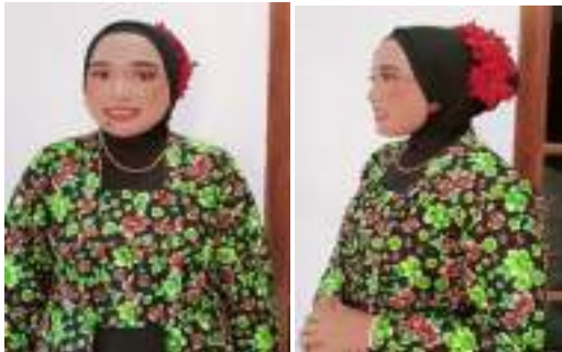
Gambar 3.30 Rancangan tata rias tari “Jagaddhita Krandon”

Tata rias pada “Jagaddhita Krandon” mengambil struktur rias nenek muda. Berkarakter nenek-nenek menggunakan warna natural namun terlihat lucu seperti komedian nenek-nenek sehingga karakternya dapat tervisualisasikan. Tata rias ini menggambarkan mbok randha krandon yang kaya raya dan baik hati. Hiasan kepala dengan khas jaman dahulu dengan memakai bunga di kepala seperti janda desa yang cantik.