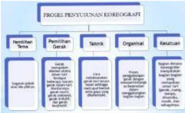
Gambar 3.13 Skema Penyusunan Koreografi Sederhana