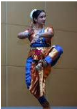
Gambar 3.2 Tari Baratanatyam

sebelum manusia). Kepercayaan masa budaya hindu bahwa tarian awalnya milik para dewa.