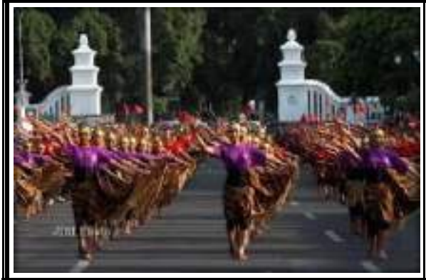
Gambar 3.6 Tari Masal