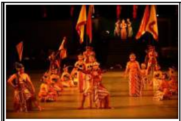
Gambar 3.11 Tari Drama Rama Shinta

sajian naratif/ kronologis dari sebuah peristiwa tertentu.