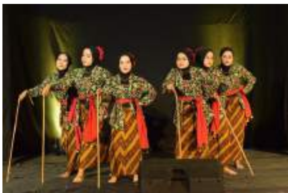
Gambar 3.29 Salah satu aksi perform Tari Jagadhita Krandon

Jagadhita berarti kesejahteraan dunia, tari ini mengisahkan janda kaya raya dan baik hati yang mensejahterakan masyarakat dengan memberikan gajah putih untuk kemakmuran warga Trenggalek. Yang pada saat itu gajah putih sebagai tumbal di sebuah dam, dan saat ini kita kenal sebagai dam bagong. Tari untuk kelas tinggi (Kelas 4 - 6 SD)