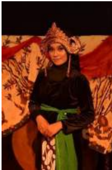
Gambar 2.7 Pemeran Roro Ayu

Jonggrang dan puteri dari Prabu Baka. Sesuai namanya, Roro Ayu adalah puteri yang cantik namun sedikit jutek. Tata rias dari Roro Ayu adalah tata rias cantik yang menggambarkan puteri yang cantik namun sedikit jutek.