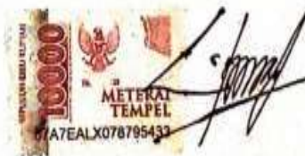
ROZAYANTI NIKMATUL MUNA