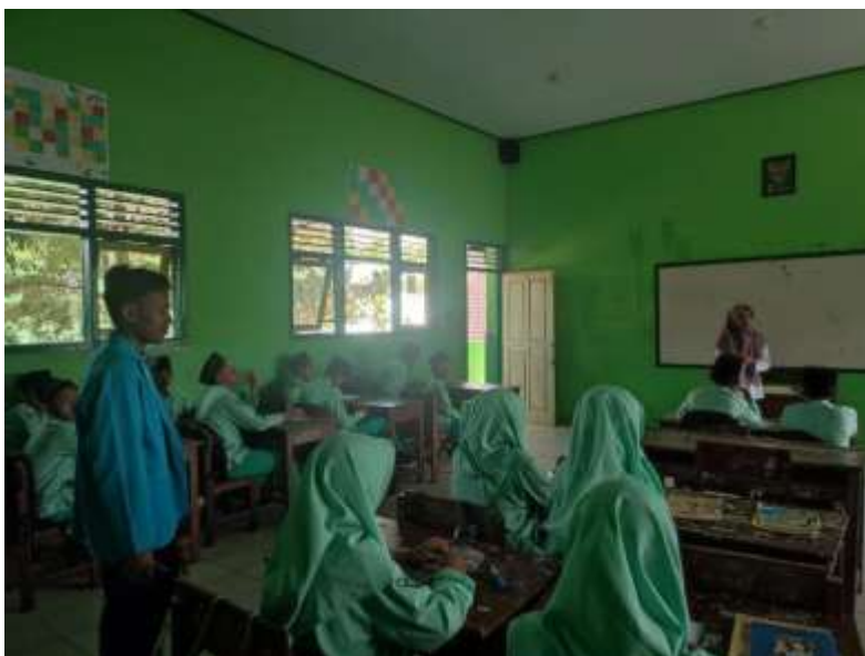
Gambar 4. proses pembelajaran dan wawancara kelas VII C