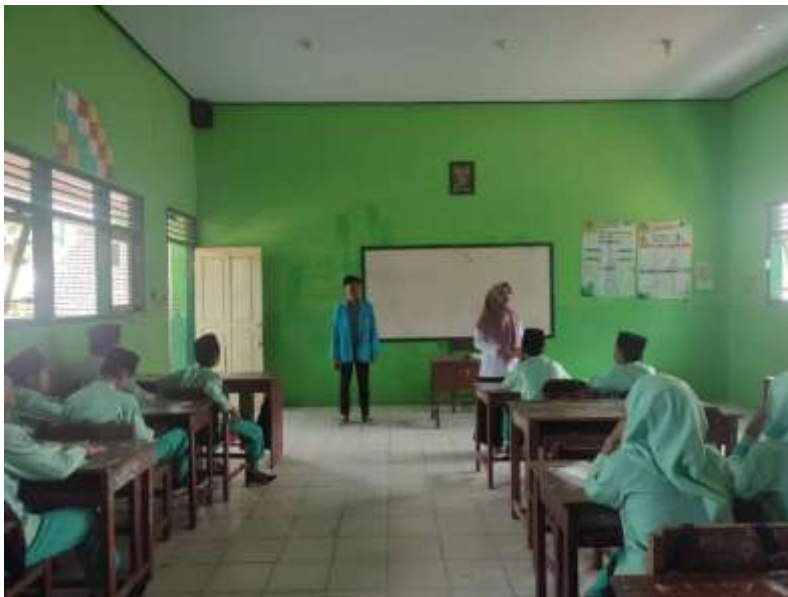
Gambar 5. proses pembelajaran dan wawancara kelas VII D