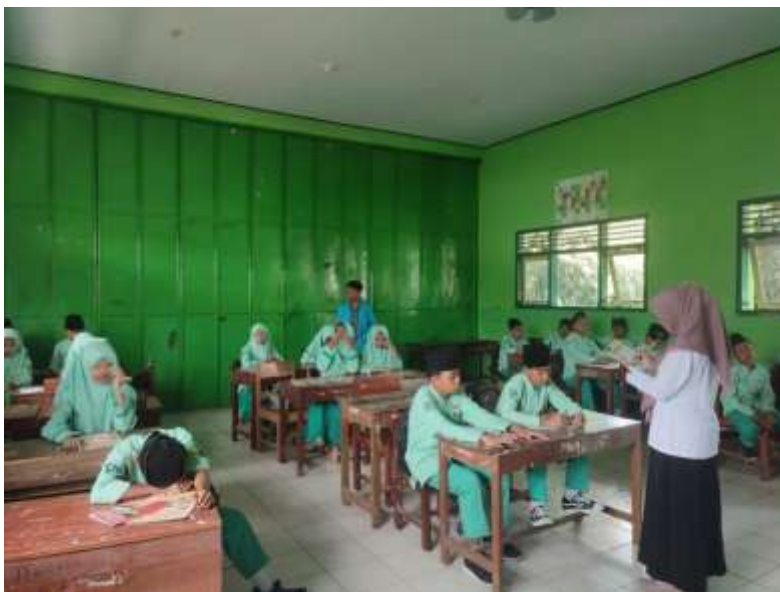
Gambar 3. proses pembelajaran dan wawancara kelas VII B