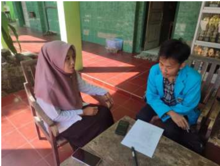
Gambar 1. wawancara dengan guru kelas (ALZ)