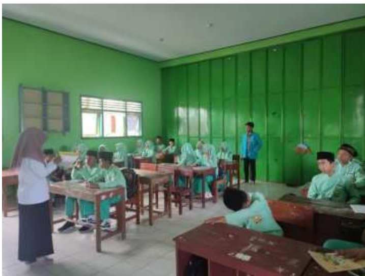
Gambar 2. proses pembelajaran dan wawancara kelas VII A